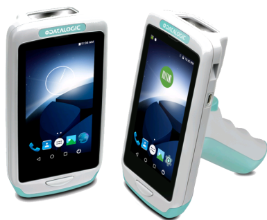
Die Health Care-Variante