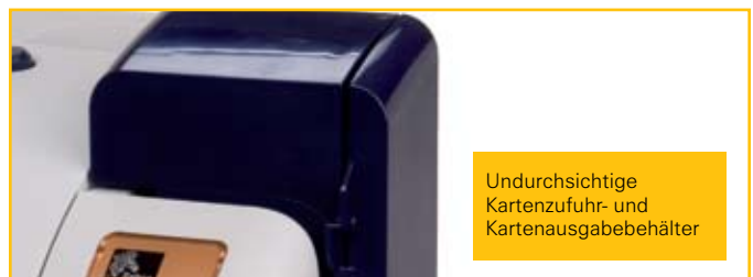
Undurchsichtige Kartenzufuhr- und Kartenausgabebehälter