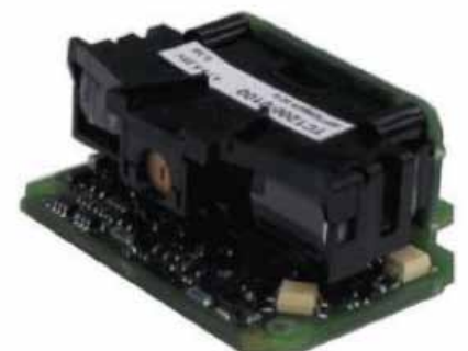
TC1200 SCAN ENGINE MODELL