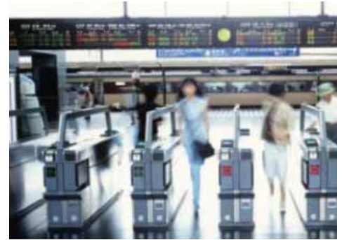
Zugangskontrolle und Ticketbuchung