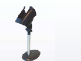
STD-P090 Halterung (STD-9000)