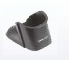
HLD-P080 Tisch-/Wandhalterung (HLD-8000)