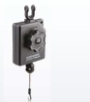
7-0404 Industrieller Seilzug