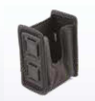
HLS-P080 Universaltasche (HLS-8000)