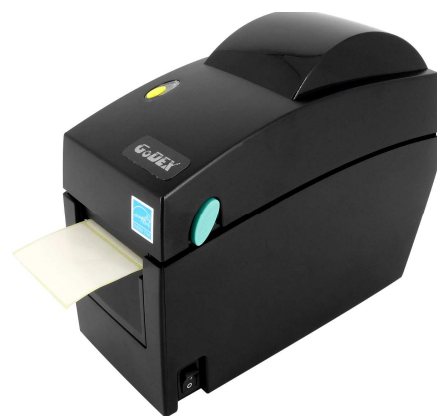
Godex DT2X kompakter Etikettendrucker

Die Möglichkeit, Etiketten innerhalb des Labors selbst zu drucken, stellt somit einen fehlerfreien Arbeitsablauf und eine zuverlässige Diagnose sicher. Ohne Etikettierlösungen würde das Labor stillstehen.